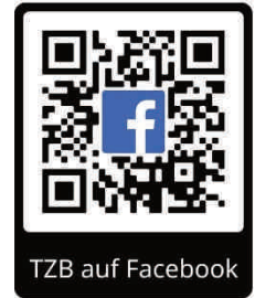
TZB auf Facebook

Falls es die im Februar geltenden Regeln zulassen, werden wir sicher auch im Dorf präsent sein und einen Narrenbaum stellen. Folgt uns auf unseren Sozialen Netzwerken für aktuelle Infos. Wir wünschen Euch eine schöne Fasnet im kleinen Kreis und verbleiben mit einem kräftigen „Hoorig“!