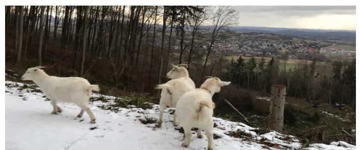
Schnappschuss vom Schienerberg