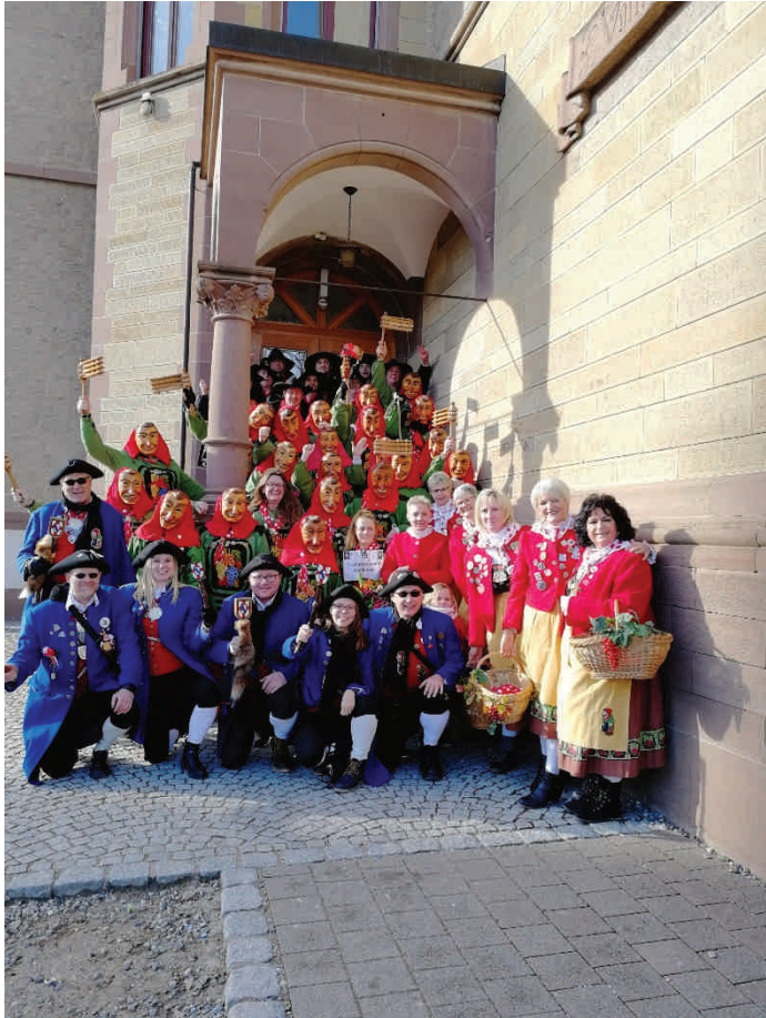
Narrentreffen 2019 in Meßkirch

Leider können wir Euch auch dieses Jahr nicht den sonst üblichen bunten abwechslungsreichen Narrenfahrplan anbieten. Wir hatten uns schon auf eine tolle Fasnet zum Pandemieende gefreut unter dem Motto „Wenn scho Fieber, denn Disco-Fever!“