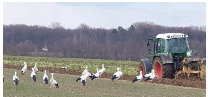
Störche auf einem Feld bei Bohlingen