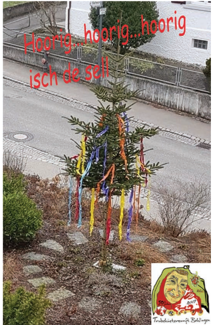
Geschmückter Narrenbaum am Rathaus Februar 2021