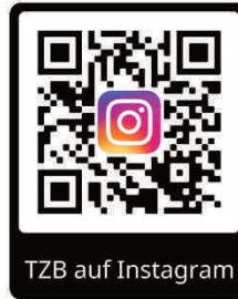
TZB auf Instagram

Am Schmutzige Dunschtig selbst, wird es zudem eine kontakt - aber nicht lieblose Fasnet in der Tüte für alle Kindergarten- und Schulkinder geben. Im Rathaus und Landkauf bekommt Ihr die Narrenzeitung wieder kostenlos! Wir machen natürlich, auch bei der närrischen Schaufensteraktion in Singen mit. Dieses Mal sind wir bei der Fa. Hepp mit unseren Figuren zu sehen.